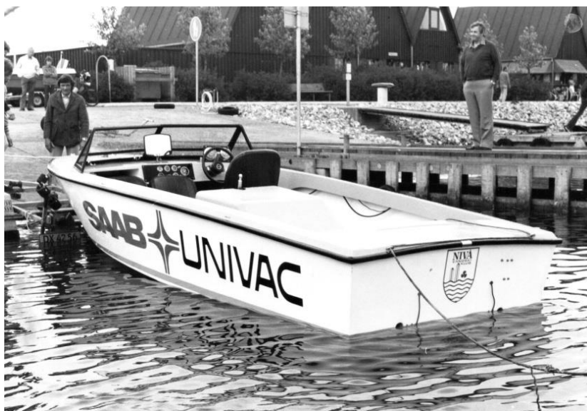
Vanskiklubbens første båd fra 1981